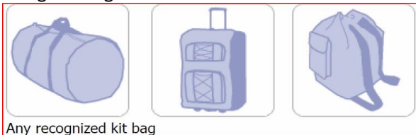
Any recognized kit bag