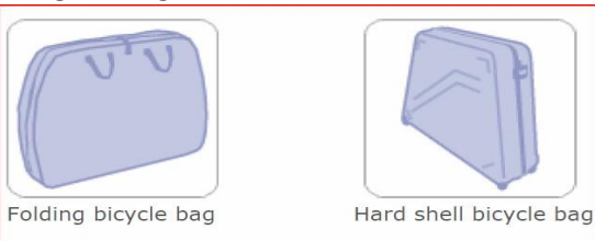
Folding bicycle bag